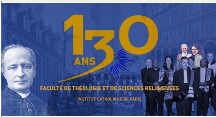
2019, l'ICP célèbre les 130 ans de sa Faculté de Théologie